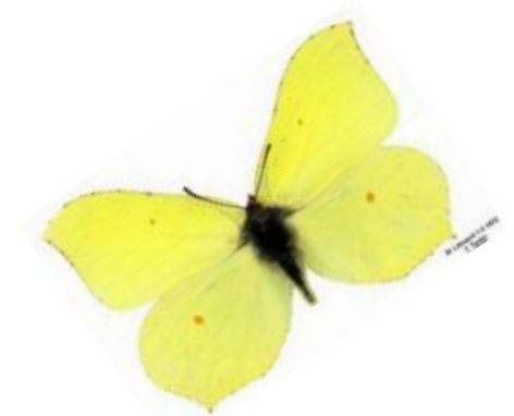
Nedan brakved Många insekter är beroende av brakved. Citronfjärilens larver äter gärna dess blad.