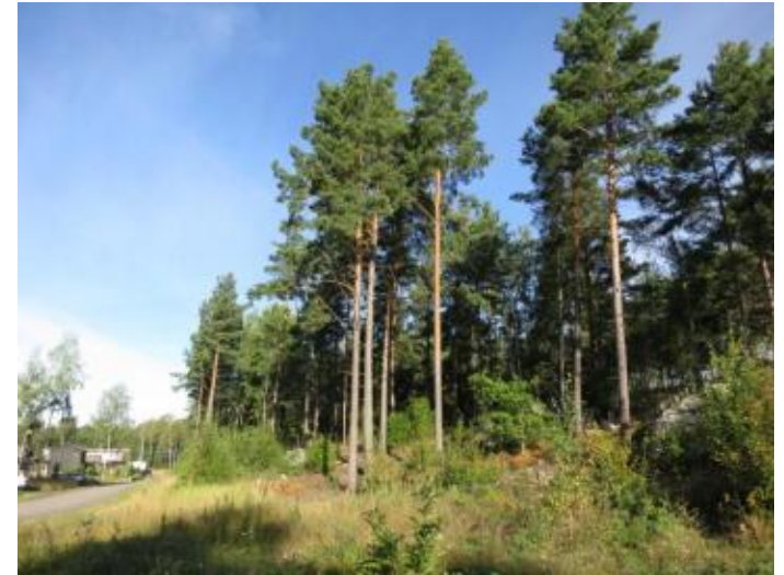
Från Mullvadsvägen i början av Mullvadsvägen.