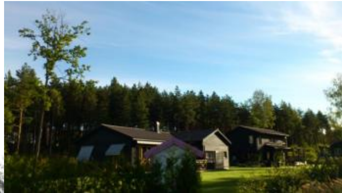
Från Mullvadsvägen i söder