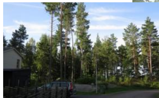
Området från övre delen av Mullvadsvägen.