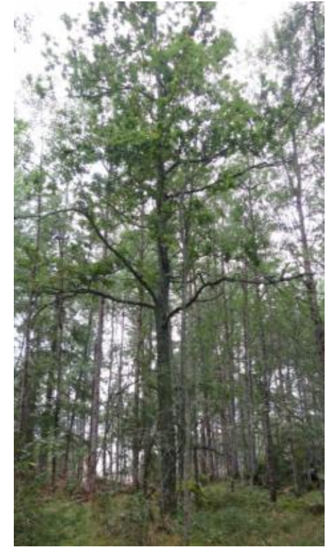
Ett par ekar friställs.