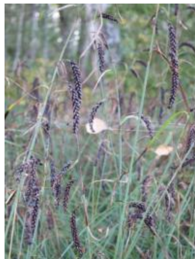
Slankstarr Carex flacca

Området lämnas i övrigt till fri utveckling.