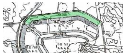
Östra områdets begränsning mot norr.

Gynna buskar i form av olvon, brakved och skogstry. Släpp upp enstaka yngre träd och i synnerhet regenererande ask. Ek och några exemplar av sälg gynnas. Träd i periferin som kan utgöra hot mot befintlig bebyggelse skall tas ner och ett visst undanhållande av övrigt sly kan vara befogat.