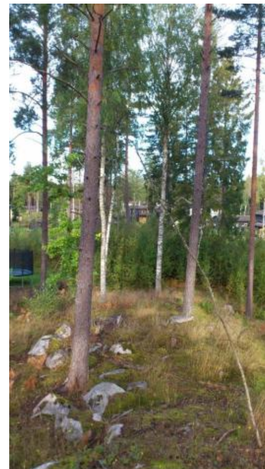
Från öster respektive väster