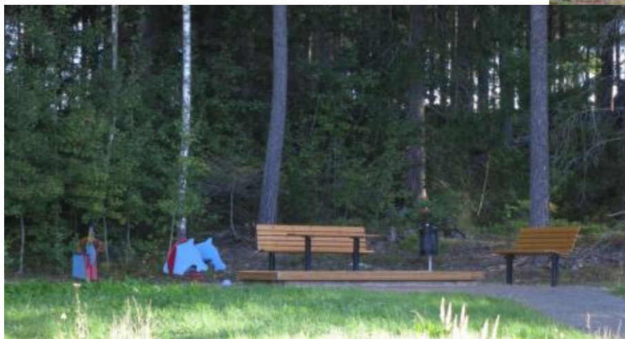
Två lekplatser finns. Vid förskolan på Lodjursvägen samt vid Igelkottsvägen.