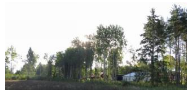
Området är Vretas entré mot Uppsala-Näs.