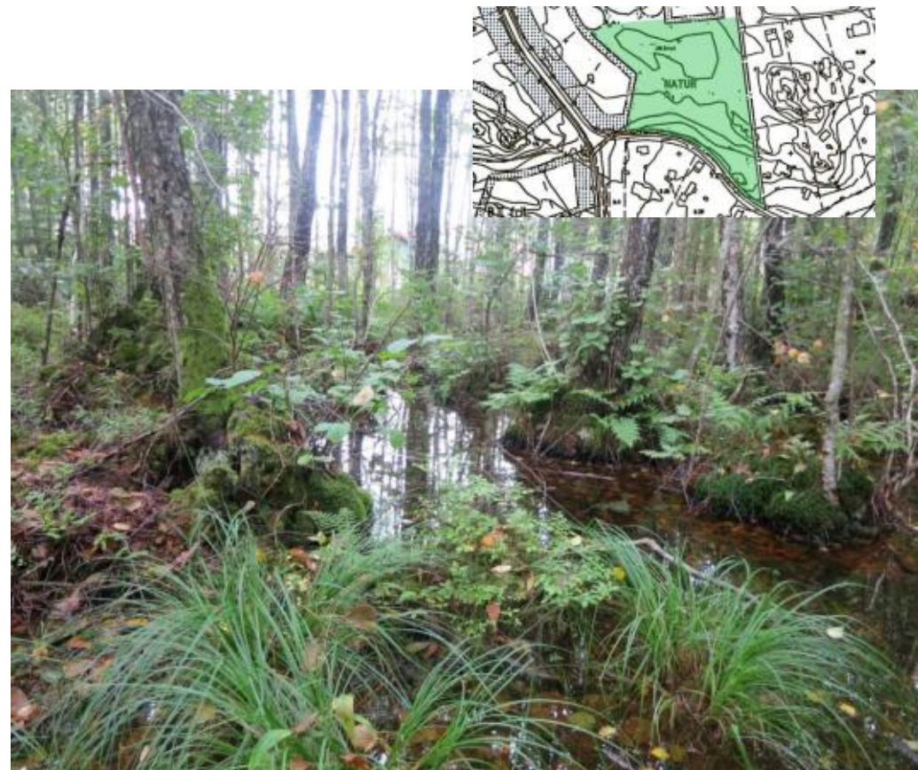
Alkärret söder om Lodjursvägens södra slut.

Alkärr är biologiskt rika områden och kanske den enda naturtyp i södra Sverige som kan räknas som naturskog då avverkningar är mycket ovanliga och marken sällan kan nyttjas för annat bruk. I vårt alkärr förekommer t.ex. brudborste, en tistelart som är ganska vanlig i Norrland men sällsynt i södra och mellersta Uppland.