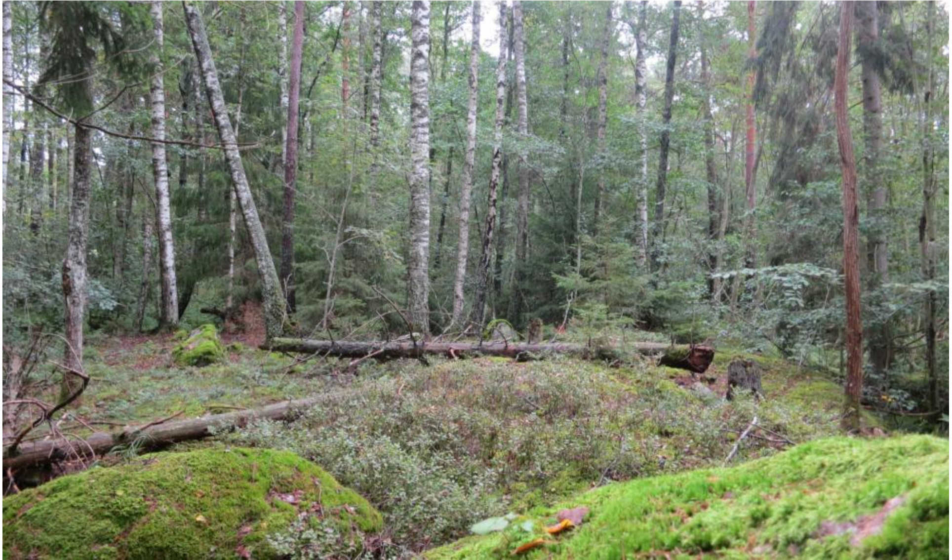
Inne i skogen finns gläntor och största delen är fastmark. En stig går igenom området.