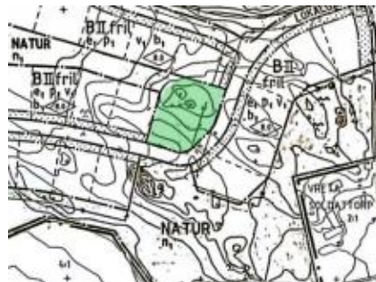
Tallkulle i kurva i övre norra delen av Mullvadsvägen.