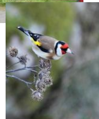
Steglitz gillar tistelfrön på vintern.